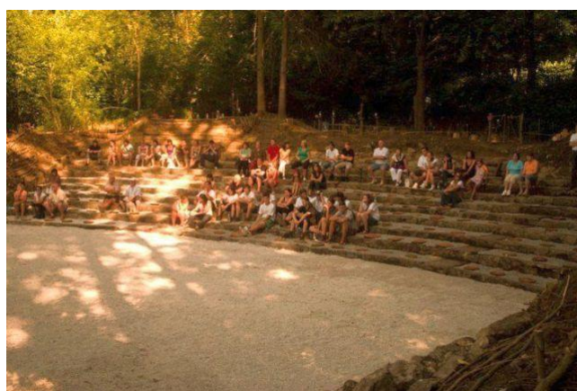
Slika 8: Letni kino ob Škalskem jezeru

https://izleti.turisticna-zveza.si/sestavi