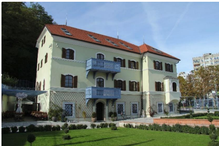
Slika 1: Vila Bianca

( https://www.visitsaleska.si/sl/saleska-valley/vila-bianca-3/ )