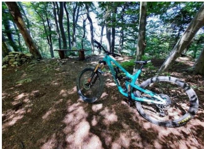
Slika 9: Vodemla Trails kolesarske poti ( https://izleti.turisticna-zveza.si/ )