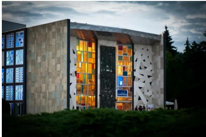
Slika 12: Kulturni dom

https://www.visitsaleska.si/app/uploads/2019/09/Dom-kulture-01-vredno-ogleda-visitsaleska.jpg