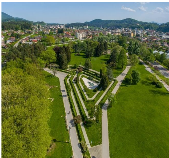
Slika 3: Pogled na Sončni park z vrha