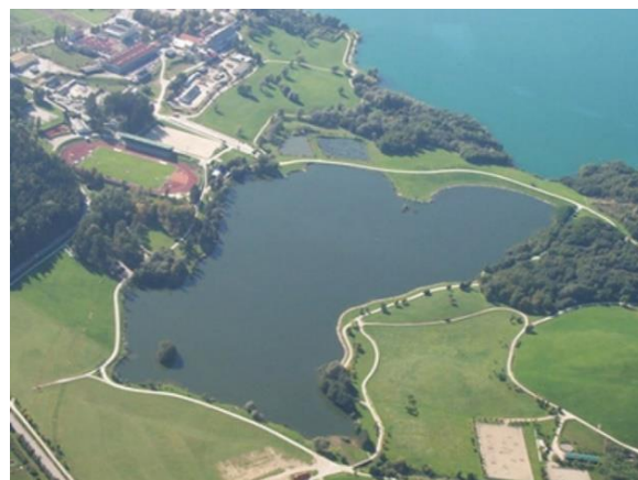
Slika 6: Škalsko jezero v dolini