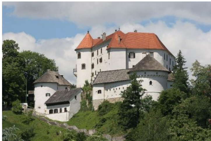
Slika 13: Grad Velenje

https://www.visitsaleska.si/app/uploads/2019/09/Dom-kulture-01-vredno-ogleda-visitsaleska.jpg