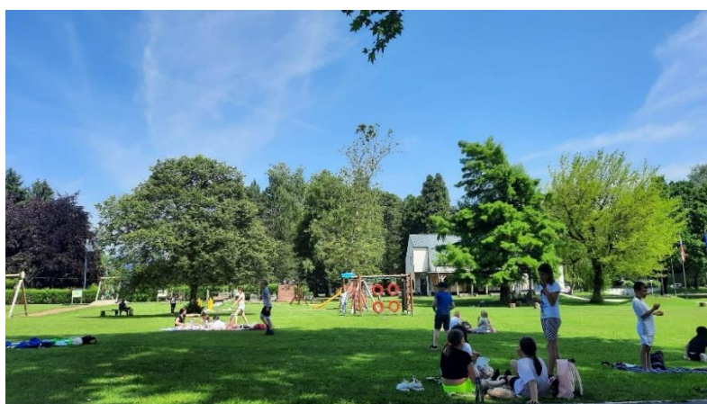
Slika 4: Igrišče v Sončnem parku