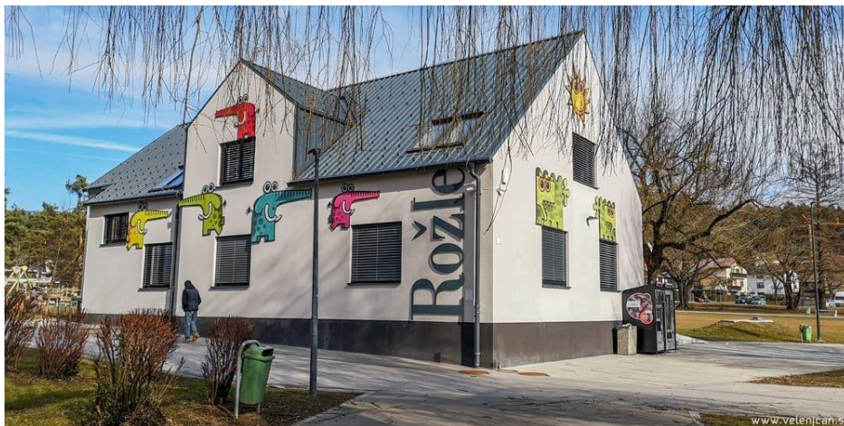
Slika 2: Vila Rožle v Sončnem parku

Stavba, ki stoji v parku, se je potem, ko je v njej nekaj časa domoval otroški vrtec z imenom Rožle, prijelo ime Vila Rožle . Zdaj je Vila Rožle sedež Medobčinske zveze prijateljev mladine Velenje , v kateri danes izvajamo številne programe, kot so Šola za starše, tečaj Lego robotike, pustna ustvarjalnica in še veliko več. Ponujamo tudi veliko možnosti za prosti čas in sodelovanje v društvih. Tako je v parku, zgrajenem z udarniškim delom, spet doma tudi prostovoljstvo.