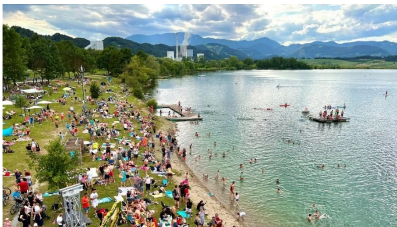
Slika 14: Velenjska plaža

https://www.culture.si/images/thumb/d/d6/Velenje_Castle_-_01.jpg/576px-Velenje_Castle_-_01.jpg