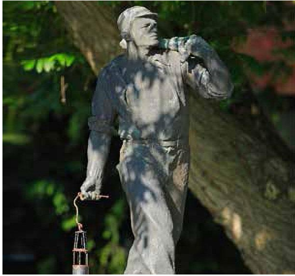
Slika 15: Kip rudarja

https://www.velenje.si/app/uploads/2022/07/rudar.jpg