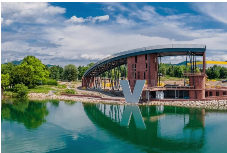
Slika 10: Vista park Velenje

https://kongres-magazine.eu/wp-content/uploads/2023/03/vista_park_velenje.png?x36696