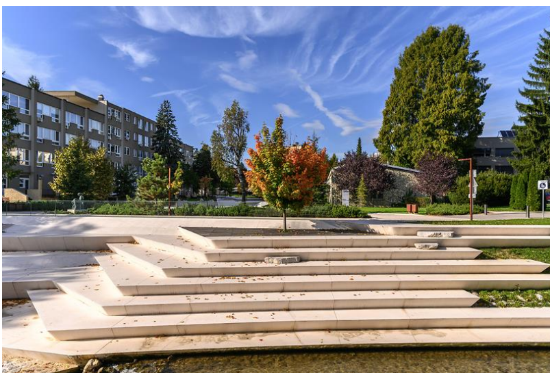
Slika 11: Promenada Velenje

https://kongres-magazine.eu/wp-content/uploads/2023/03/vista_park_velenje.png?x36696