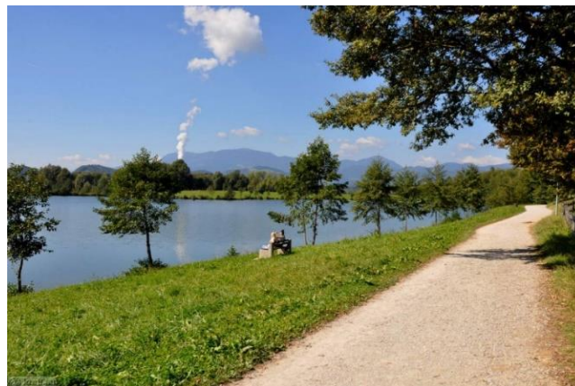
Slika 5: Sprehajalna pot okoli Škalskega jezera

( https://lipovlist.turisticna-zveza.si/skalsko-jezero/ )